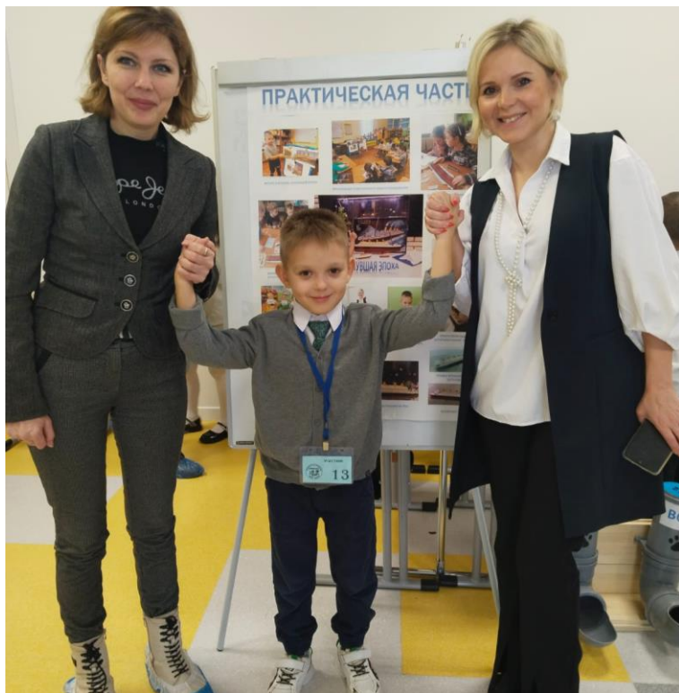
Малая Декада наук «Эврика?!»