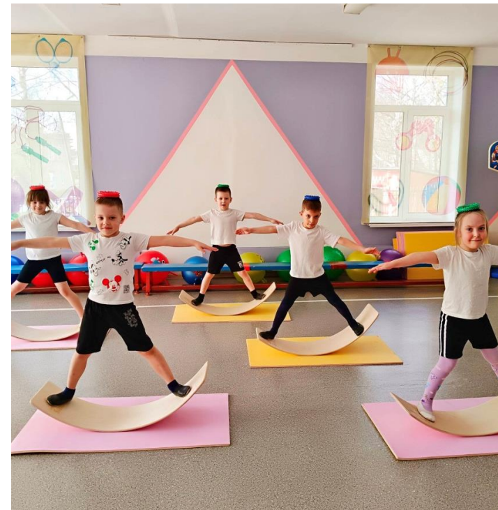
Сибирские борды, нейрогимнастика