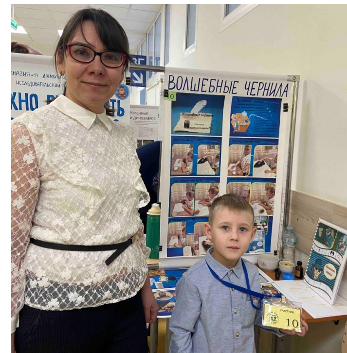
Проект «Волшебные чернила»