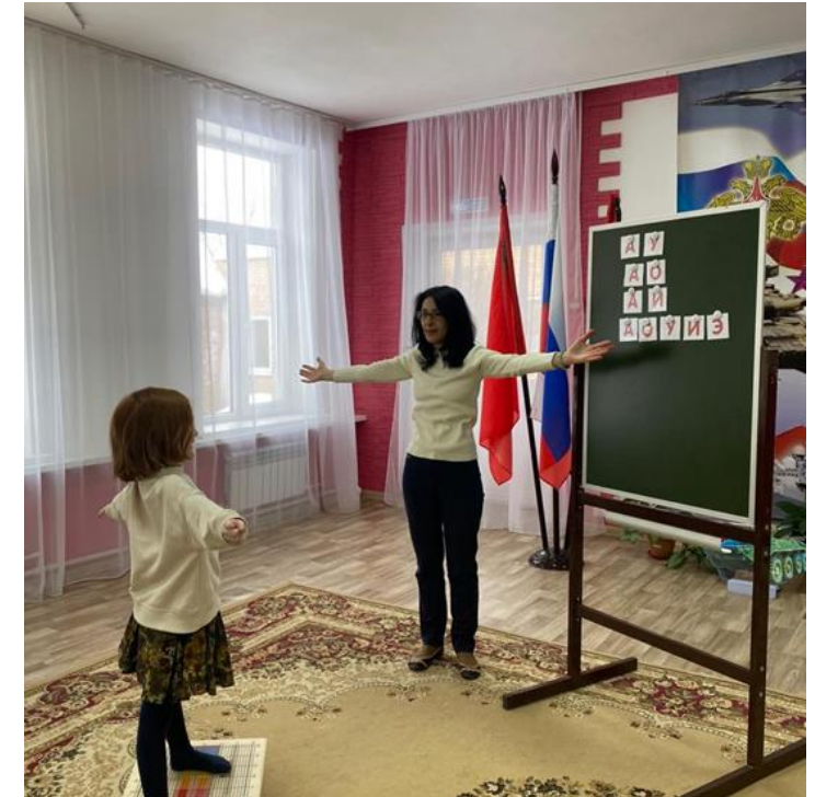
Межполушарное развитие с использованием балансировочного комплекса BALAMETRIX