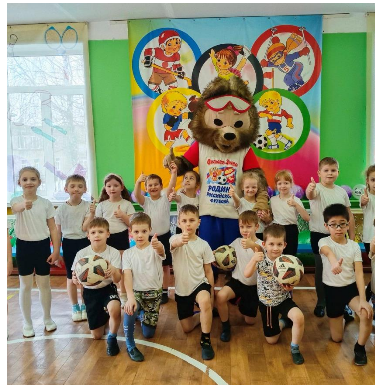
Футбольная школа «Морозовец»