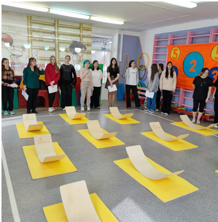
Мастер-класс «Физкультура нового поколения»