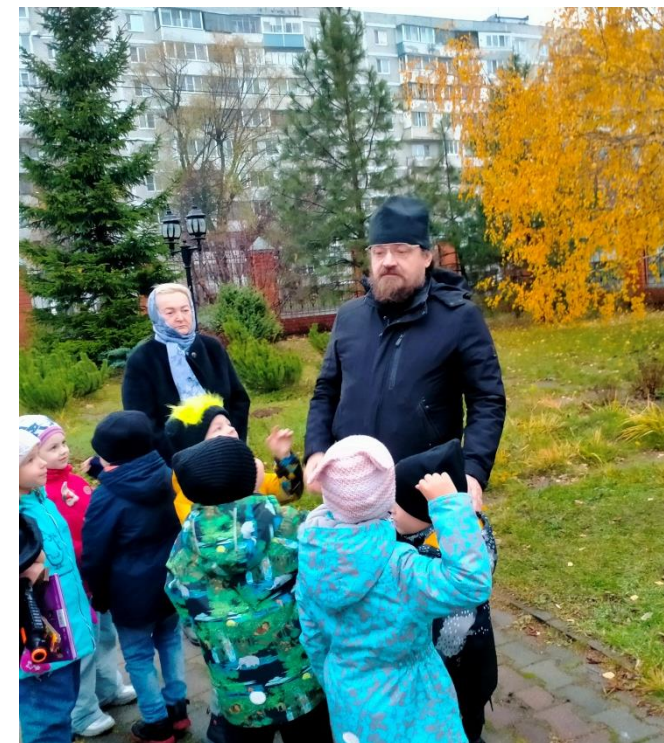
Церковь Пресвятой Богородицы