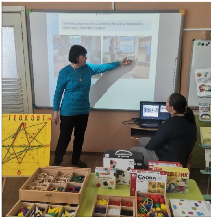
Семинар-практикум «Современные практики образования»