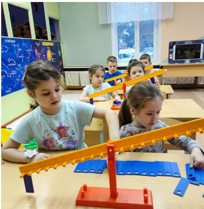
Измерение и решение логических задач с помощью весов