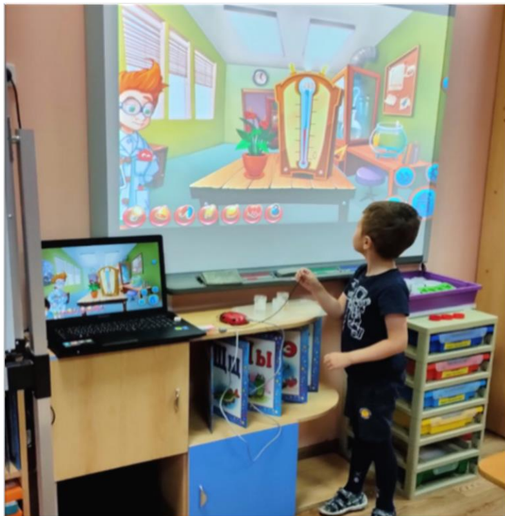
«Наураша в стране Наурандия»