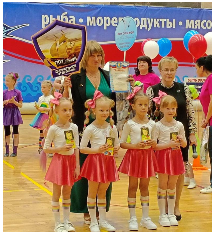
МУ «Дворец спорта «Восток»