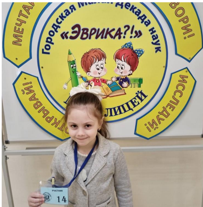
Проект «Мультфильм своими руками»