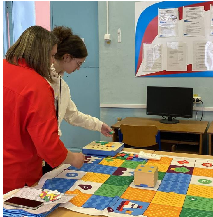
Схемы, модели, способы проектирования