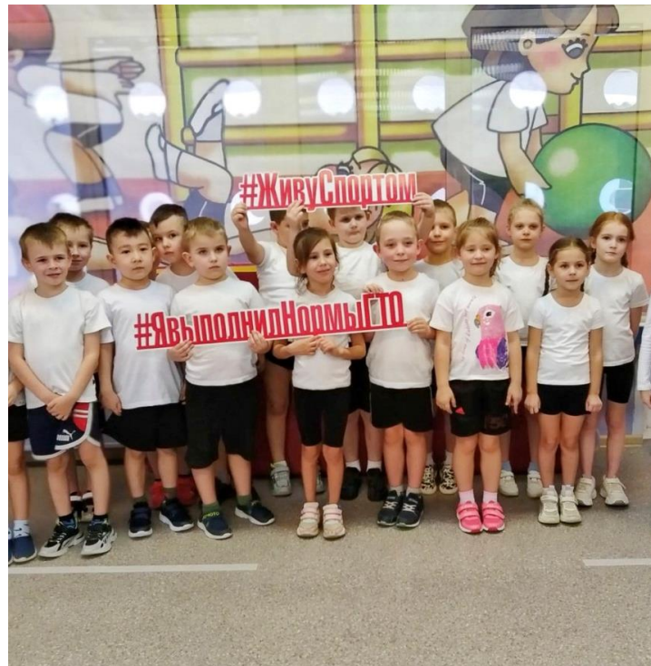
Сдача норм ГТО