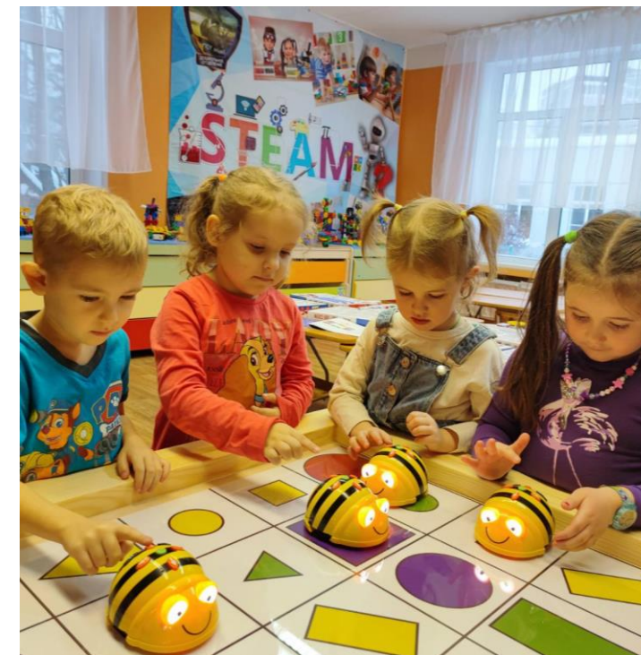
Занимательная математика с «Умными пчелами»