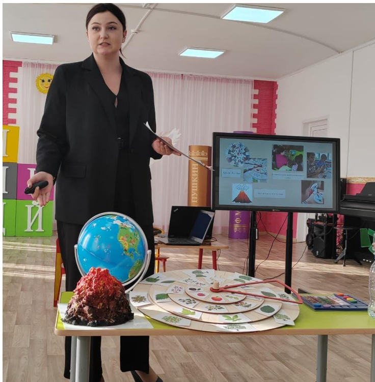
Лауреаты конкурса «Педагог года — 2023»