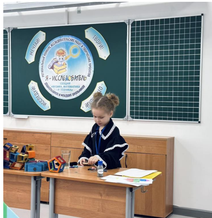
Проект «Волшебные магниты»