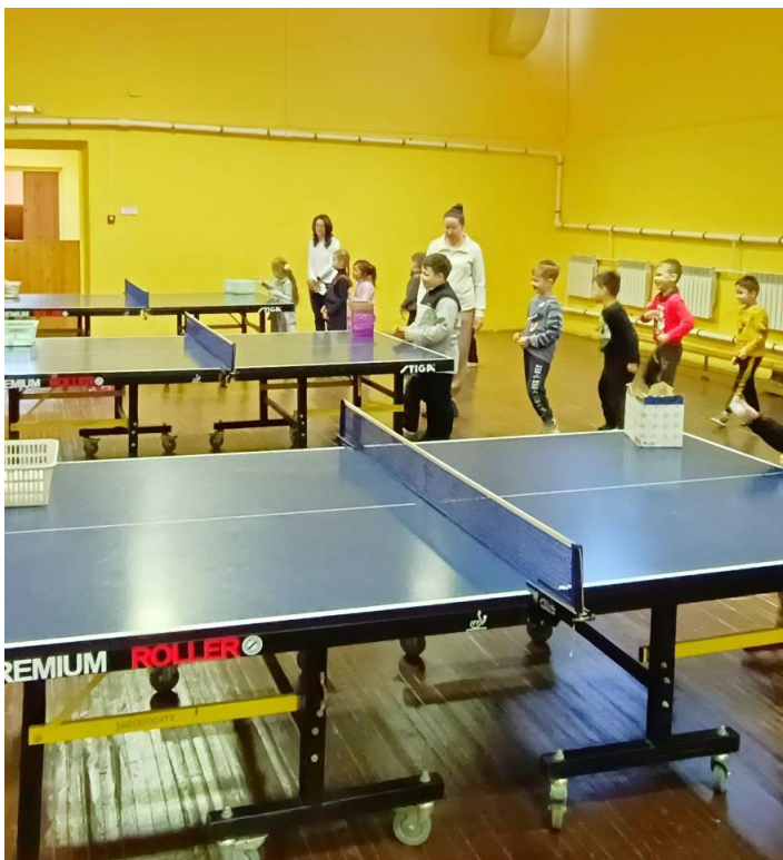
Спортивная школа «Спартак-Орехово»