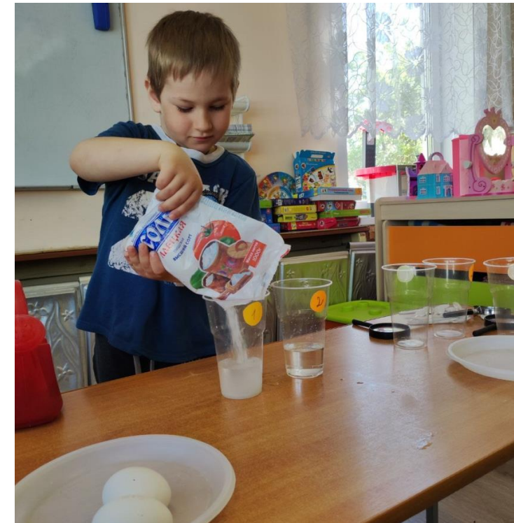
Ответ на вопрос экспериментальным путем