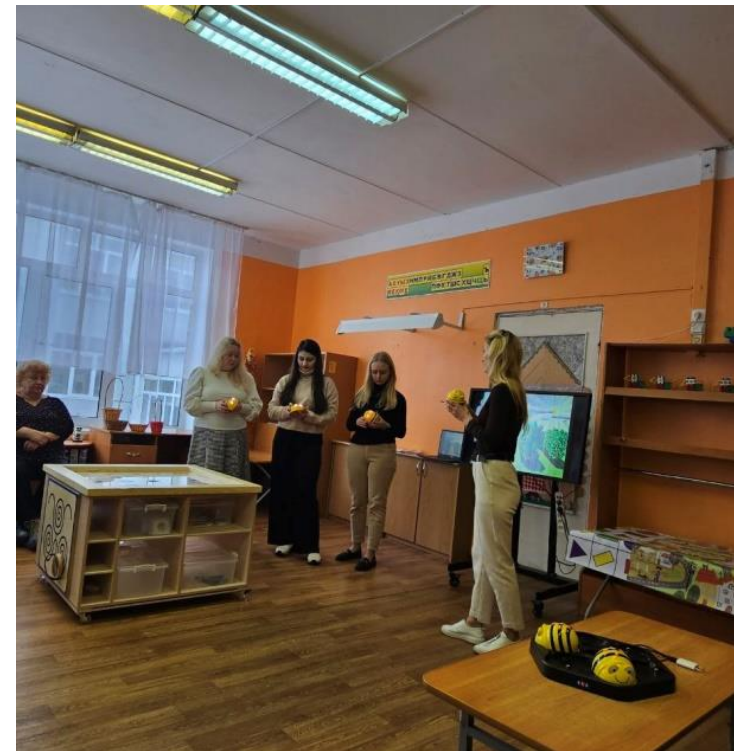
ГМО «Stem-образование в ДО»