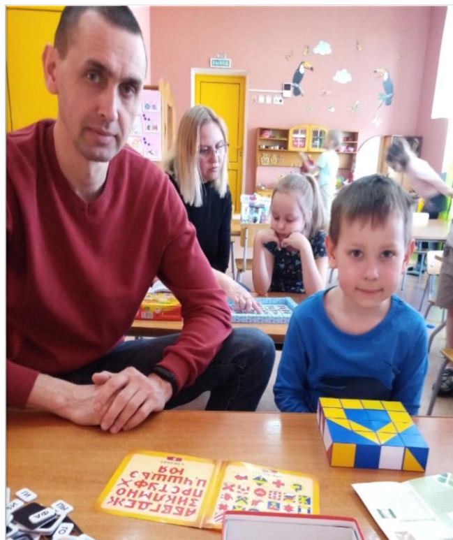
День открытых дверей