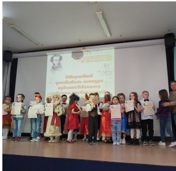
Детская библиотека «АЗ-Буки»